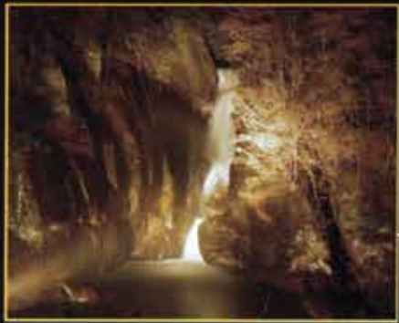
仙娥滝ライトアップ